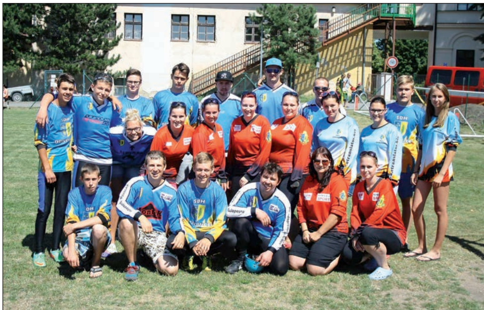
Soutěžní družstva mužů a žen