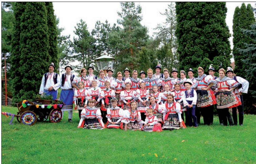
4. Svatofloriánské hody