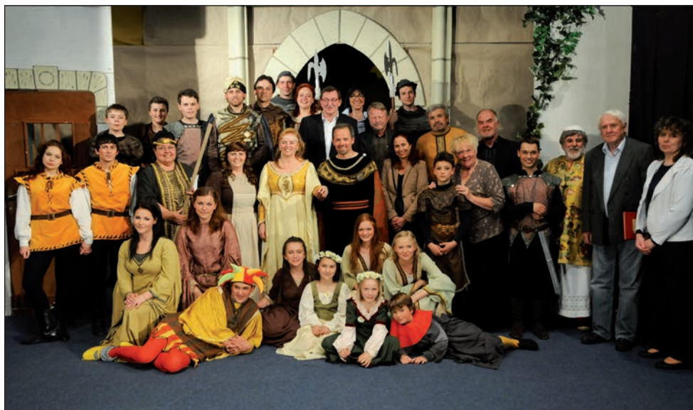
Jedna noc na Karlštejně