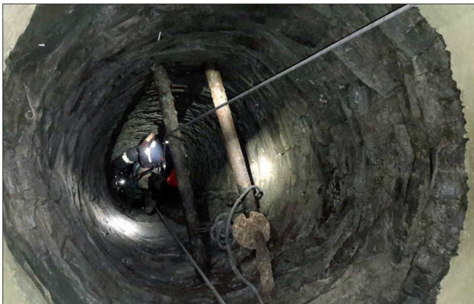
Záchrana osoby ze studny