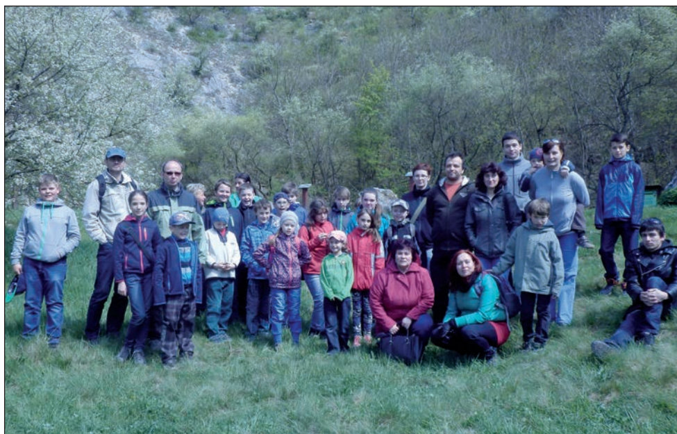
Výlet do Mikulova a Aqualandu Moravia