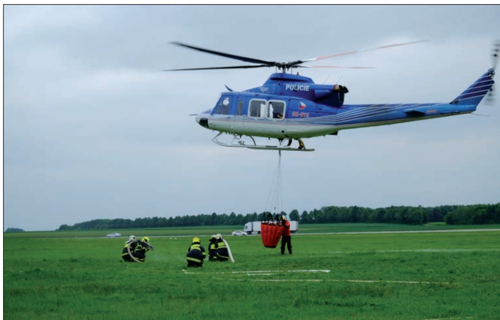
Výcvik jednotky s vrtulníkem LS PČR