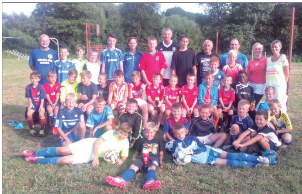
Svojanov u Moravské Třebové - soustředění mládeže 24. 7. - 28. 7. 2015