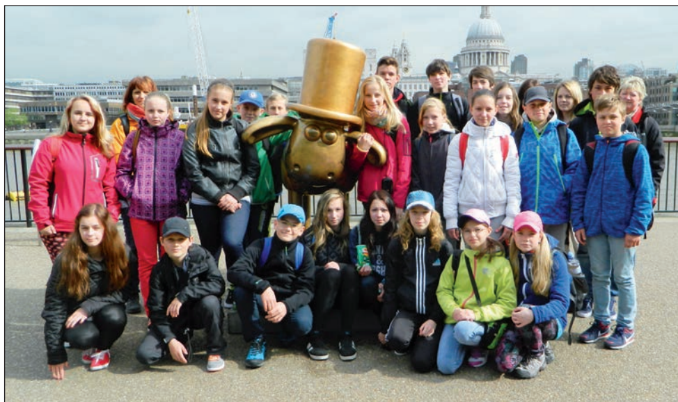
Poznávací zájezd Anglie