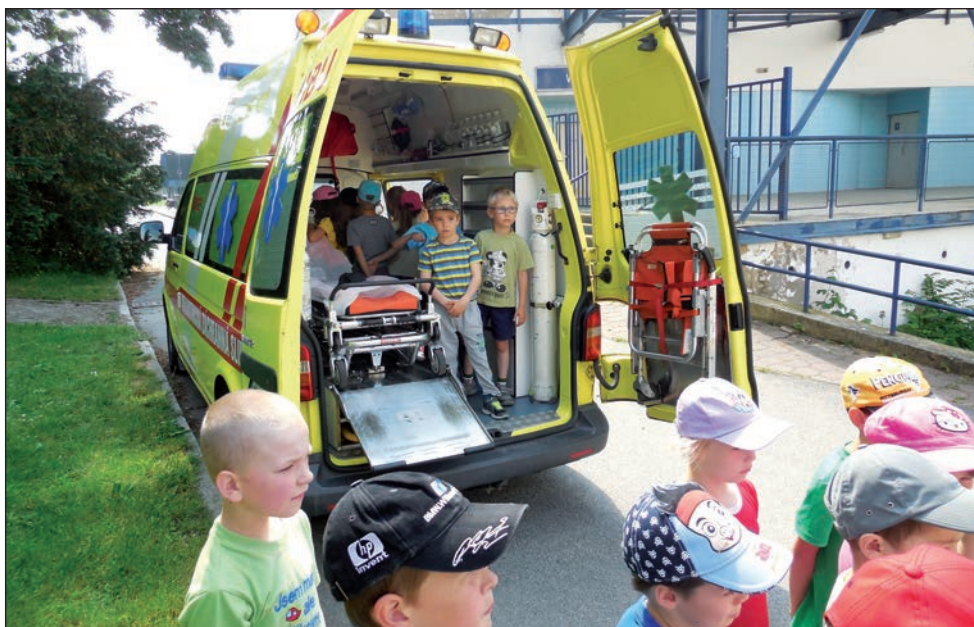
Záchranáři v mateřské škole