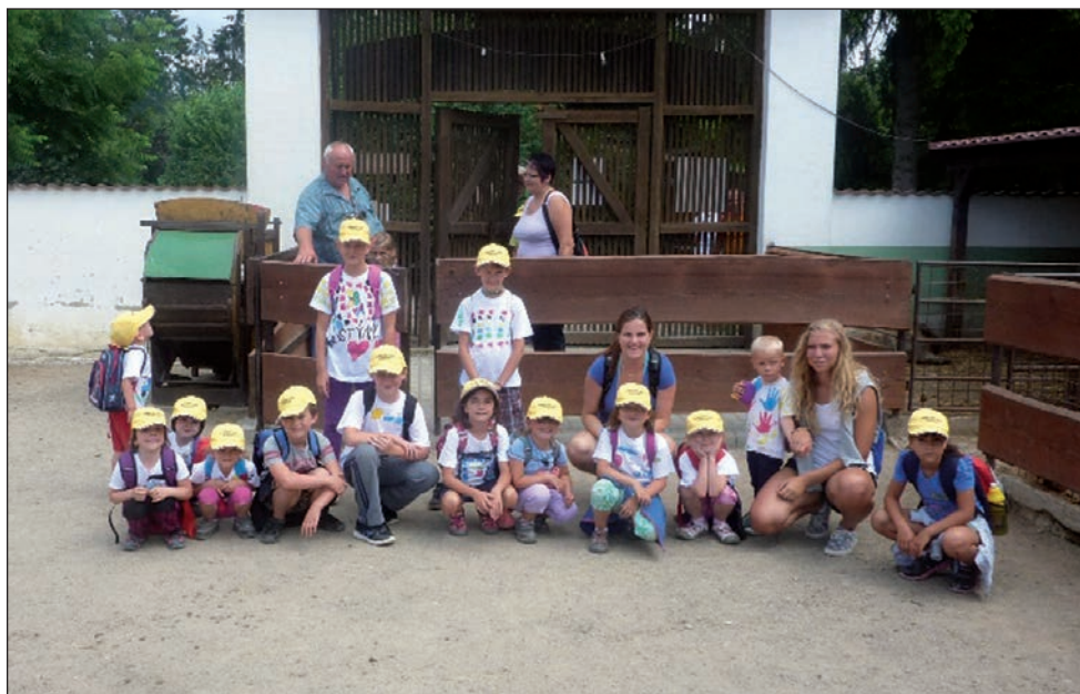
Část dětí z červencového příměstského tábora