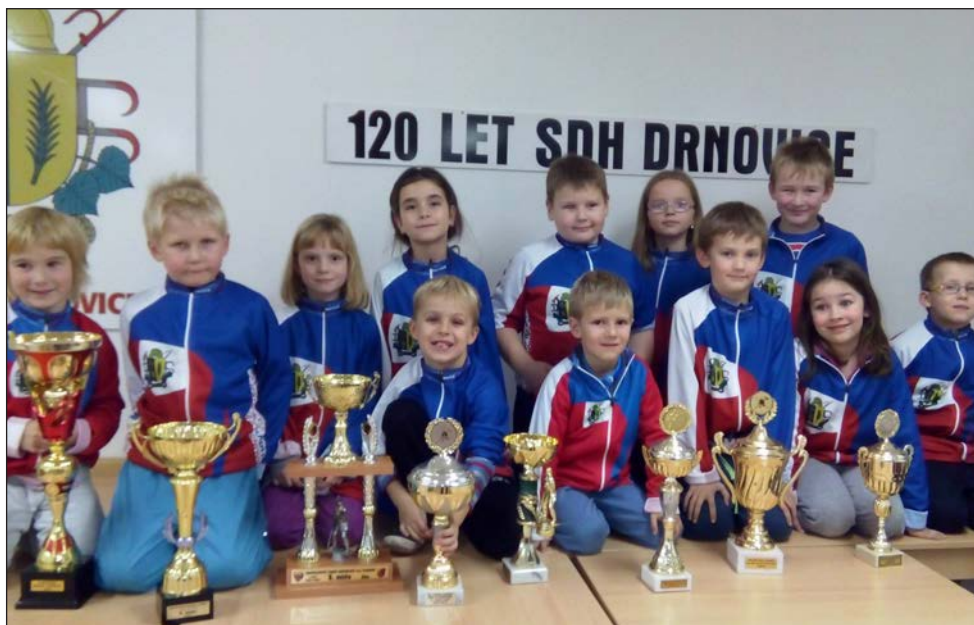
Družstvo mladších žáků Drnovice