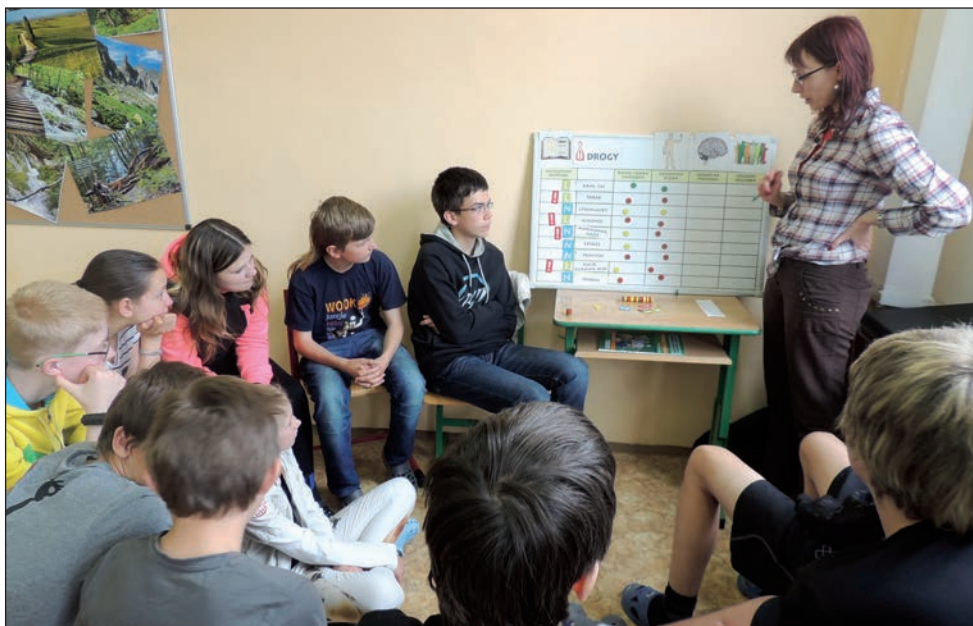
Prevence kouření a návykových látek