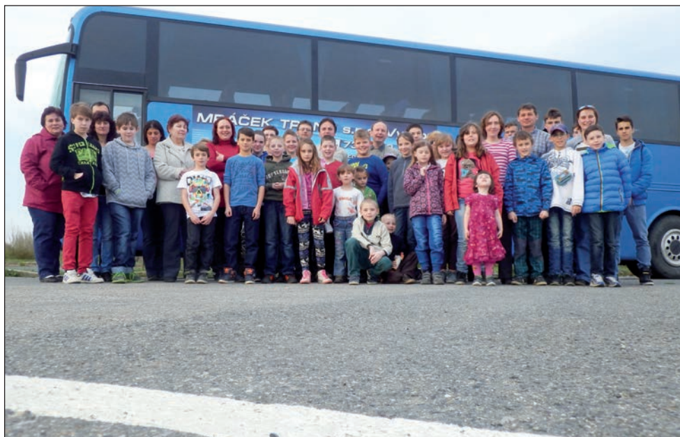
Výlet do Mikulova a Aqualandu Moravia