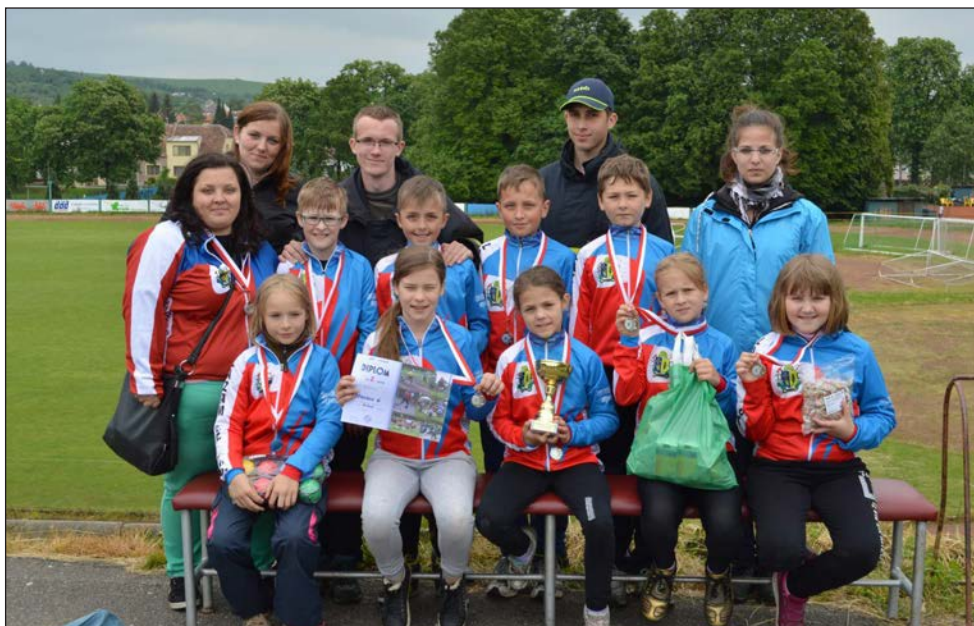
Družstvo mladších žáků Drnovice