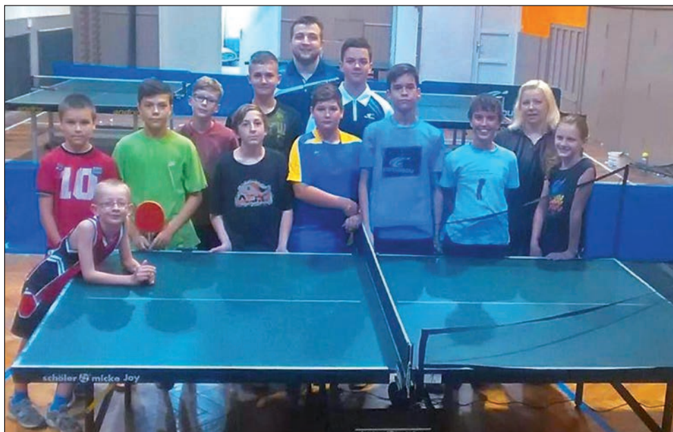
Práce s mládeží