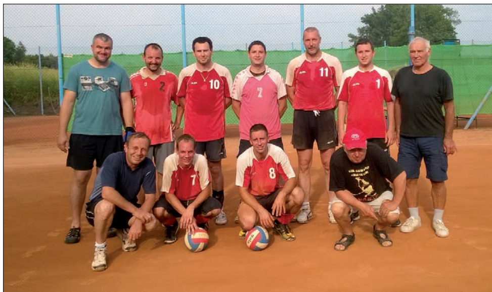
TJ Sokol Drnovice