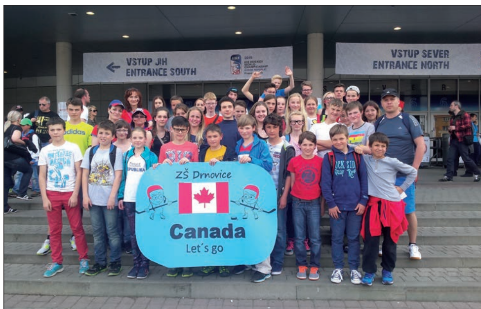
Návštěva MS v hokeji