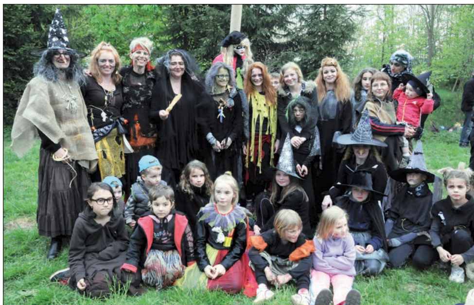
Slet čarodějnic na Křivdě (Kolokoč a Drnka), duben 2015