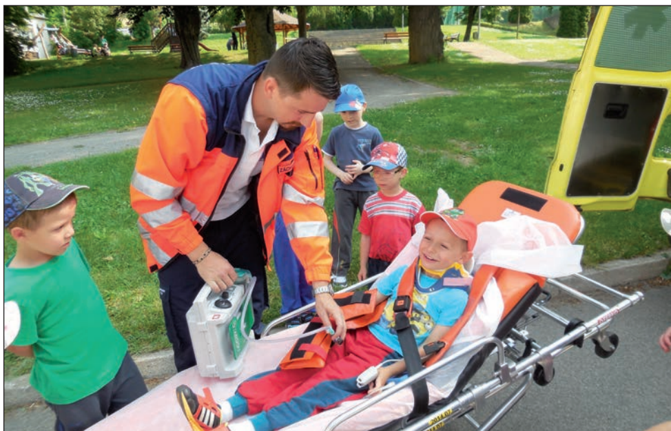
Záchranáři v mateřské škole