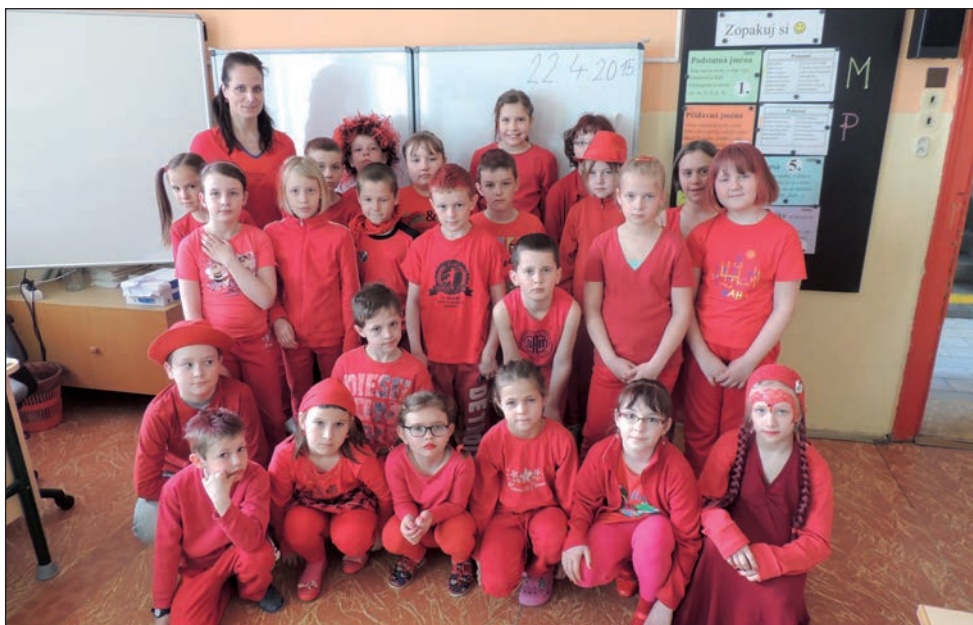
Den Země - Den barev - 3. třída