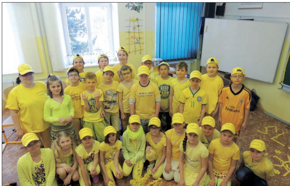
Den Země - Den barev - 4. třída